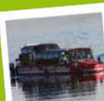
Le Crocodile Rouge Unieke in België!

A la recherche du trésor englouti ... Commencez la visite par un film drôle et original. Embarquez ensuite à bord du Crocodile Rouge, équipés de casques audio, et poursuivez la quête du trésor en compagnie des personnages à la fois loufoques et instructifs.