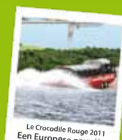
Le Crocodile Rouge 2011 Een Europese première!